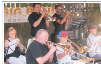
Leitung: Andreas Griesbacher