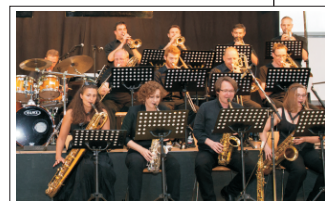
Big Band Gössendorf