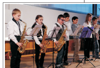
Ensemble- musizieren im Musikheim Gössendorf